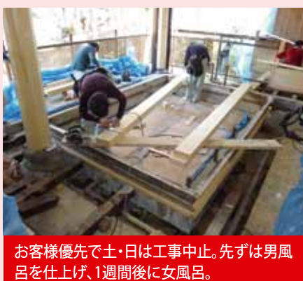
お客様優先で土・日は工事中止。まずは男風呂を仕上げ、1週間後に女風呂。

平成23年、当社にとって初めての県外出張工事を経験しました。場所は栃木県・日光のホテル「季節の遊」。これまで耐震性に問題があり、木造3階建ての別館を休館にしていたのですが、再度開館したいという要望です。現場を訪ねると、老朽化が激しく、一番重要な1階は、鉄の応急用柱で支えられている状態でした。更に2階の部屋の壁を取り払い、大広間にしたいとの要望です。この