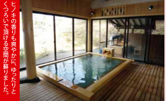
ヒノキの香りも爽やかにゆつたりとくつろいで頂ける空間が蘇りました。

早かったと思うとソツとします。その時のご縁もあり、今回は道路真向「星の宿」の浴室改修の紹介を頂きました。4月10日無事終了、日光が益々身近な存在となりました。