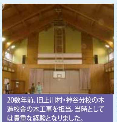
20数年前、旧上川村・神谷分校の木造校舎の木工事を担当。当時としては貴重な経験となりました。

つい最近、東洋ゴム工業の免震装置のデータ改訂が露見し、日本中で大問題になっています。ところで、皆さまは木造の家について、構造の安全性を確かめる「構造計算」は当然であると思ってい