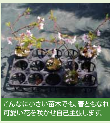
こんなに小さい苗木でも、春ともなれば 可愛い花を咲かせ自己主張します。

昨年、当紙5月号で紹介した桜 の新興「結核」。この桜を切る掛け に、阿賀野市を「桜のまち日本一」に しようという話を持ち上がりまし た。以来、女性を主体とした有志 が、阿賀野市観光課や各商工会等 とも何度も話し合い、既に一年超を 経過しています。