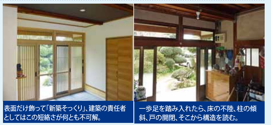
表面だけ飾って「新築そっくり」、建築の責任者 としてはこの短絡さが何とも不可解。

修理・修繕・改装・改築 気軽に電話下さい 人口減少に伴い新築が益々縮小 する日本の住宅市場。大手ハウス メーカーもリフォーム工事にシフ トしています。が、リフォームを望 む家の殆どは築後30年以上、時に は100年も経過したものもありま す。従って、今風の構造体とは根本 から違つたのです。現物に対する対 応ですから、各社の新築ノウハウ は通用しません。構造に手を加え るとなると、職人の技術と経験が 絶対条件です。家は人の命と財産 を守る構造物であり資産です。大 金を掛けて、一時は見栄えと住み 心地は良くなったが、後でこんな つもりではにならないように。